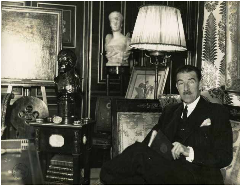
Le baron Gourgaud dans le salon de La Grange, vers 1930